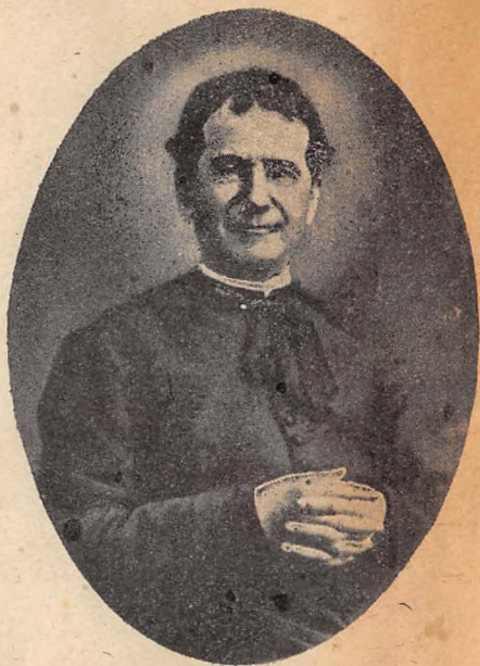
SAN GIOVANNI BOSCO