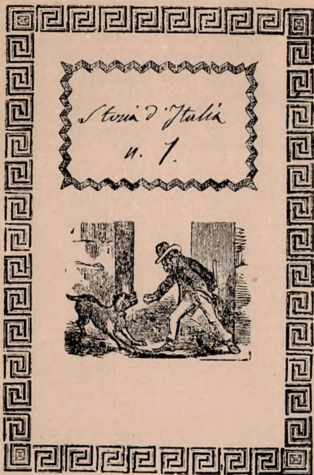
L'UMILE QUADERNO DI SCUOLA CON TITO- LO AUTOGRAFO CONTENENTE UN ABBOZZO DI RIFUSIONE DELLA STORIA D'ITALIA . (Arch. Cap. Sal., 87-F-VII). Orig. cm. 14,5x19,5.