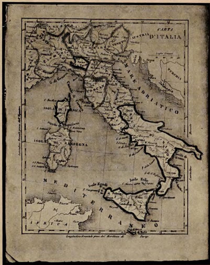
LA CARTA D'ITALIA ANNESSA ALLA I E II EDIZIONE DELLA STORIA D'ITALIA. (La fotografia dà in nero i toni gialli). Orig. cm. 16,5×20,5.