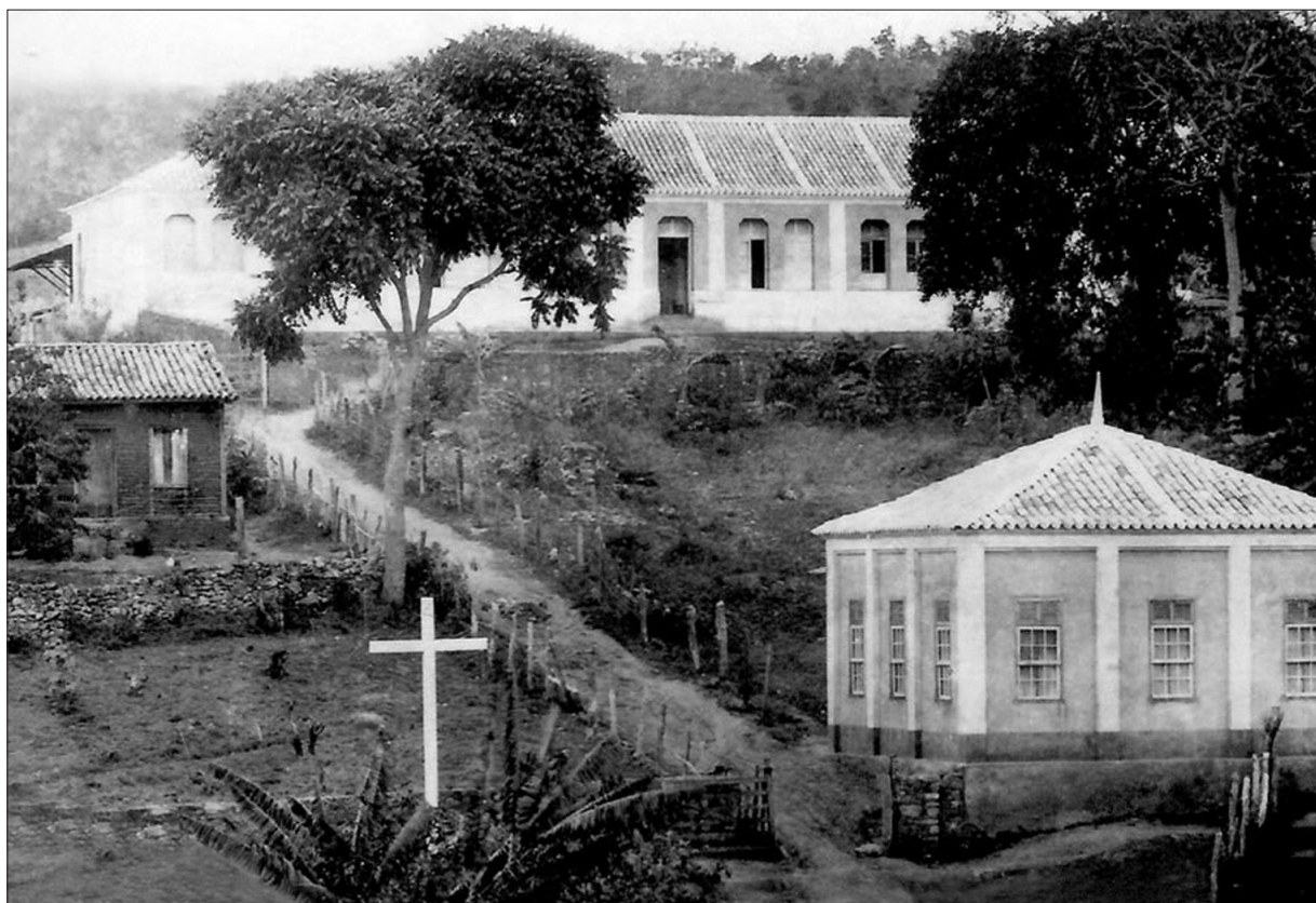
Primeira escola municipal