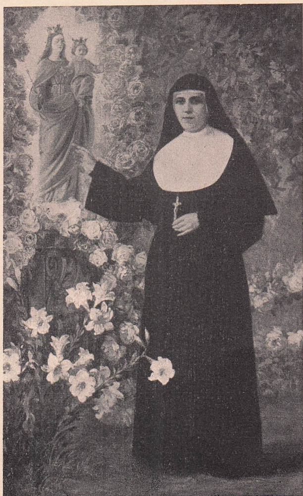
Suor Maria Mazzarello