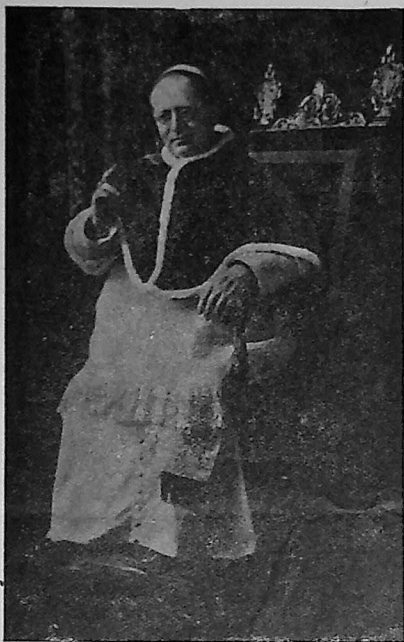
Il Papa della Canonizzazione

soccorrendo e visitando infermi. Egli, presentato loro da Monsignore medesimo, propose subito ad esse che si facessero Cooperatorie Salesiane, proposta che accettarono di buon grado.