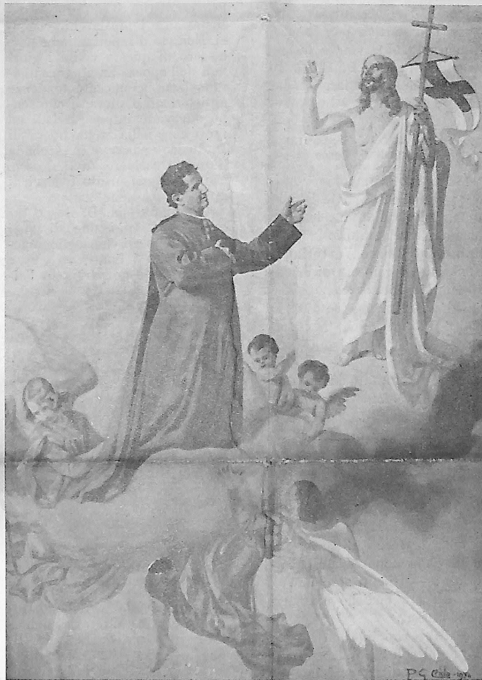
Cristo Risorto accoglie D. Bosco nel cielo dei Santi

E così fu. Fece circa cinquecento chilometri, nutrendosi co-