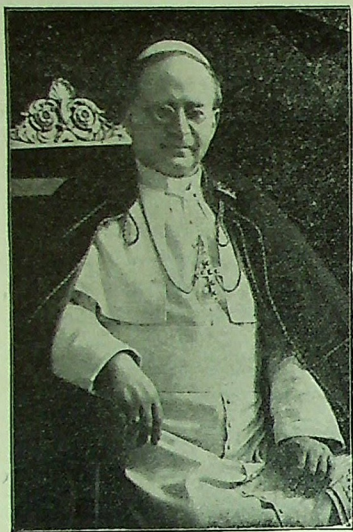
Il Papa della Beatificazione

“ La figura del gran servo di Dio si profila all'orizzonte non solo