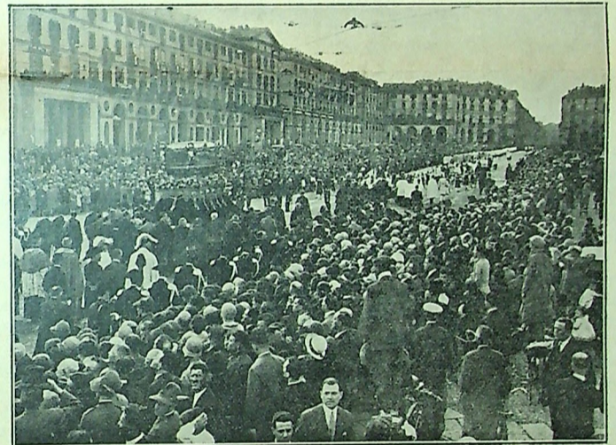
Il trionfale corteo della Salma del Beato per le vie di Torino

« Mi direte che non merito, ho proseguito, che non ho abbastanza fede: metto tutta quella che ho. Mi direte che è volontà di Dio che io non guarisca e rimanga ammalata; se è così dategli un segno sensibile