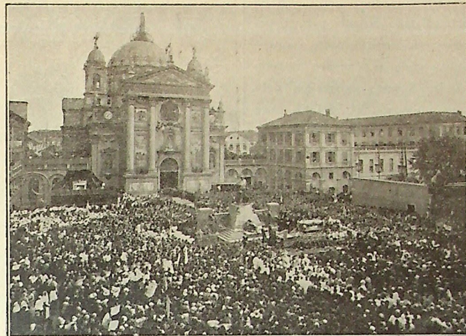
Piazza e Basilica di Maria Ausiliatrice gremita di folla.

Le condizioni per essere iscritti all'Unione dei Cooperatori Salesiani sono: 1. Età non minore di 16 anni; 2. Godere buona reputazione religiosa e civile; 3. Essere