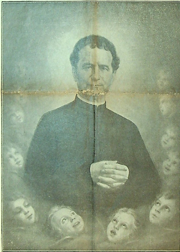
Beato Giovanni Bosco (1815 1888)

gregazioni passate. La vostra Congregazione è nuova nella Chiesa, perchè di genere nuovo, perchè venne a sorgere in questi tempi in maniera che possa essere ordine religioso e secolare, che abbia voto di povertà ed insieme possedere, che partecipi del mondo e del chiostro, i cui membri siano religiosi e secolari, claustrali e liberi cittadini. Il Signore ciò manifestò ai giorni nostri e questo io voglio rivelarvi. La Congregazione fu istituita perchè si veggia e vi sia il modo di dare a Dio quello che è di Dio, a Cesare quello che è di Cesare, secondo quello che disse Gesù ai suoi tempi: " Date a Cesare quello che è di Cesare e a Dio quello che è di Dio ... E vi predico che la Congregazione fiorirà, si dilaterà miracolosamente, durerà nei secoli venturi e troverà dei coadiutori e dei cooperatori, fino a tanto che cercherà di promuovere lo spirito di pietà e di religione, ma specialmente la moralità e la carità...