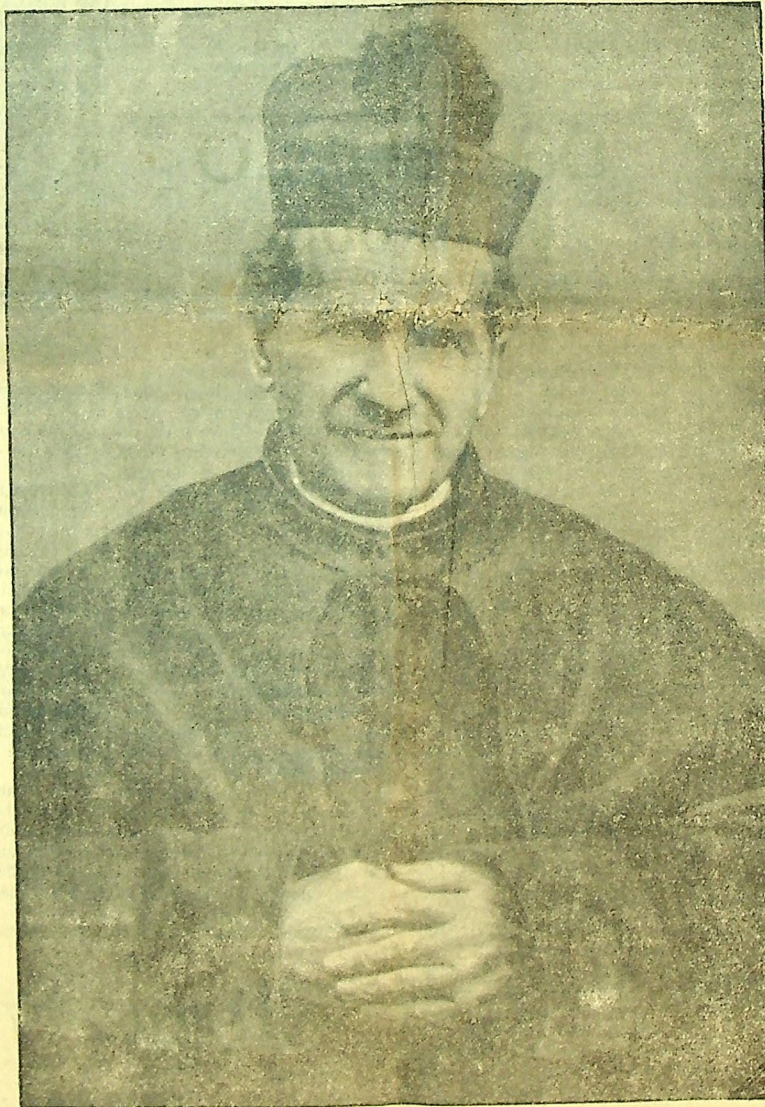
PADRE DON JUAN BOSCO, FUNDADOR DE LA CONGREGACIÓN SALESIANA.

"Beatísimo Padre, siento un gozo como infinito, dando a la Santidad Vuestra a nombre del Rector Mayor y de la Familia Salesiana, los más sentidos y vivos agradecimientos por haber-