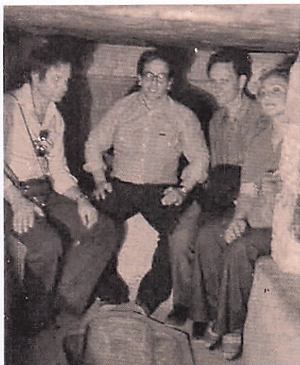
Al Cairo nel 1996

per giovani italiani e stranieri, sia in Palestina che a Torino e dintorni. Segno questo che, nonostante l'inserimento nel mondo tecnico-scientifico con l'inevitabile influsso dell'allora mentalità positivista e pragmatica, il cuore oratoriano di don Roberto mai cessò di pulsare nella direzione dei ragazzi che attendevano il suo ministero.