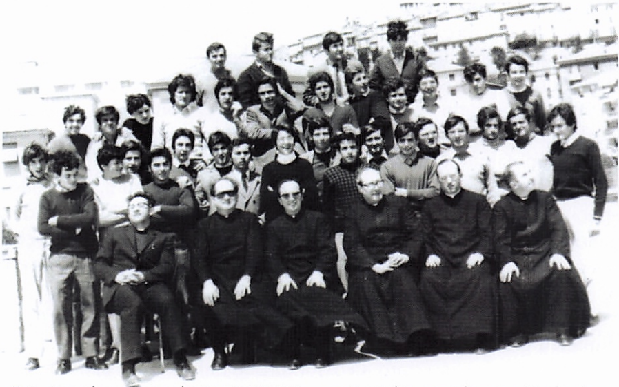
Foto ricordo anno scolastico 1971/72: pronti per l'esame di maturità classica.