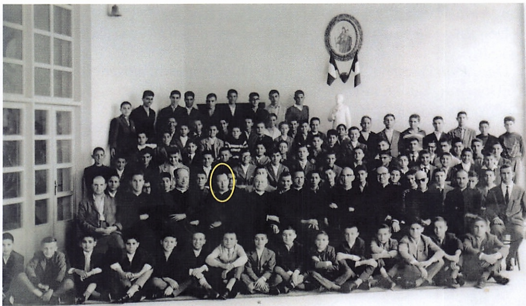
A Fossombrone anni 1958-1963 con l'incarico di insegnante e catechista dei numerosi aspiranti.