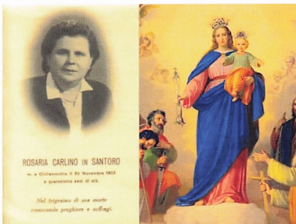
Il ricordino della mamma defunta accanto all'immagine di Maria Ausiliatrice.

Quando arrivai alla stazione, poco dopo la mezzanotte, chi mi accolse mi disse "Coraggio!", e capii. Mi rivedo ancora inginocchiato accanto al letto della mamma morta. Fu allora che mi affidai totalmente a Maria, scegliendola come mia Madre; forse pensando a Don Bosco dopo la morte di mamma Margherita. E tale Maria è stata per me in tutti questi anni, più volte mi ha liberato