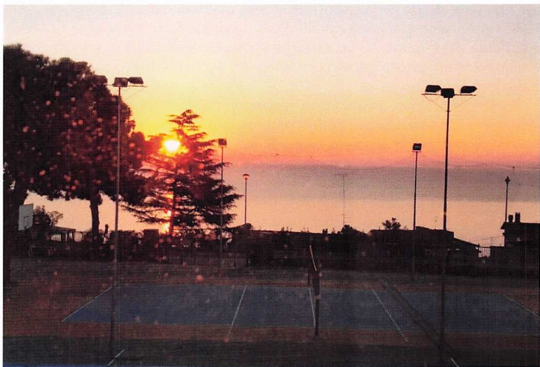
Un'alba dalla casa di Vasto: in primo piano il cortile dell'oratorio.