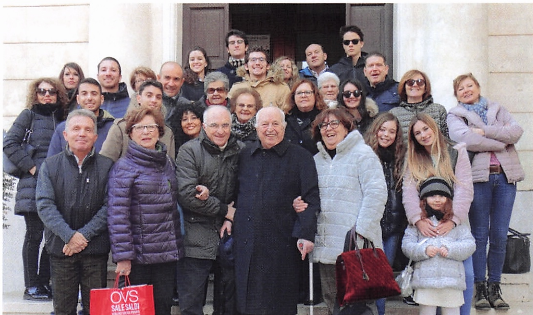
L'ultima festa di famiglia a Civitavecchia, 2022.