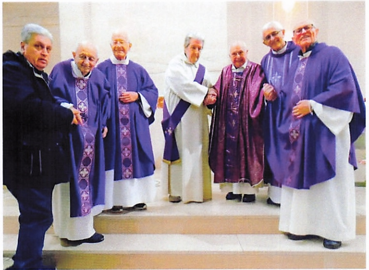
L'ultima Messa celebrata in chiesa: 16 marzo 2023, 71° anniversario di sacerdozio.

essere puntualmente presente il 16 marzo alla celebrazione del 71° anniversario della sua ordinazione sacerdotale. Quel giorno concelebra con tutti i confratelli, lascia la parola al direttore per l'omelia ma alla fine della commovente celebrazione non manca di salutare e ringraziare i numerosi fedeli presenti, ammirati per la sua tenacia e la sua intramontabile voglia di incontrare, salutare, ringraziare tutti.