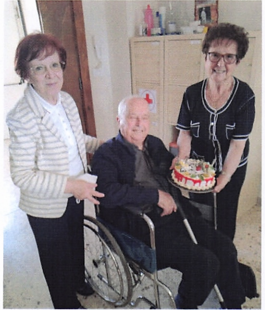
Sempre circondato dall'affetto dei fedeli della parrocchia... per il suo compleanno la torta non può mancare.