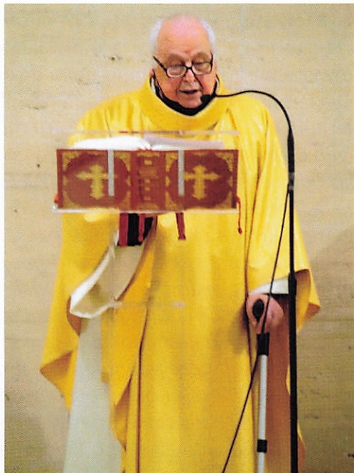
Solenne celebrazione del 70° di Sacerdozio: 16 marzo 2022.

Il secondo tempo , che abbraccia un secondo ciclo di 40 anni è stato caratterizzato da un clima di rinascita, di progresso a livello sociale, ma anche religioso. Il Concilio Vaticano II, la successione dei Papi, santi e sagge guide della Chiesa, la fioritura di movimenti religiosi che hanno creato nella Chiesa una nuova primavera dello Spirito. A livello civile, la caduta di radicate ideologie, la formazione di un'Europa più unita, lo sviluppo scientifico e tecnologico hanno dato un'impronta nuova alle fisionomie delle nazioni. Per me, sceso in campo, spesso come capitano di squadra, questo secondo tempo è stato di impegno, ma anche di soddisfazione. Ne sono conferma le amicizie contratte, l'affetto degli exallievi. Il merito va anche all'arbitraggio, sempre