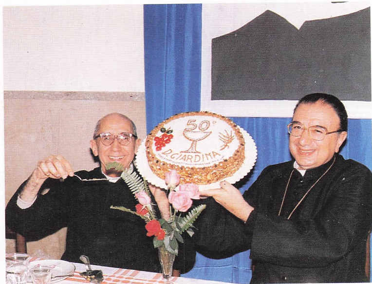
Col vescovo di Noto nel 50° di sacerdozio