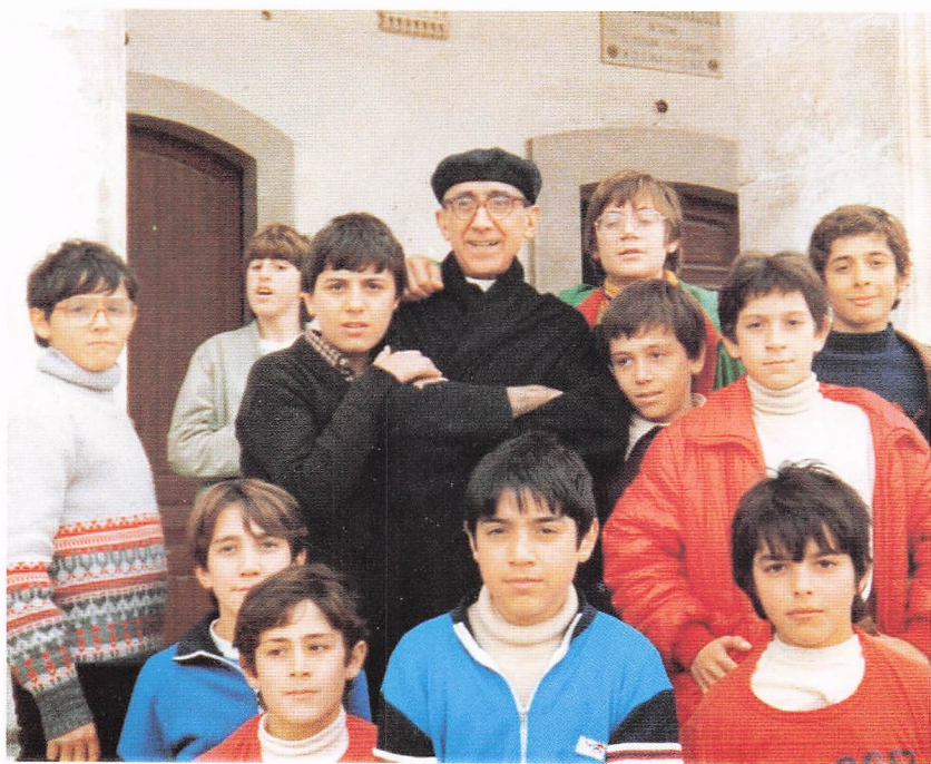
Io con voi mi trovo bene (Don Bosco)