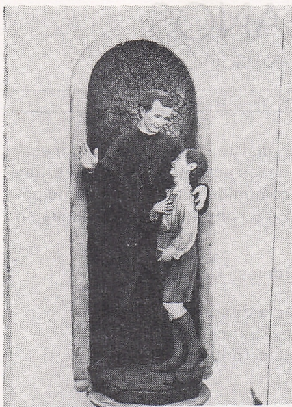
SAN JUAN BOSCO.