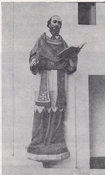
SAN FRANCISCO DE SALES

Fue entonces cuando escogió como celestial patrono al Santo Obispo de Ginebra, San Francisco de Sales, quien se distinguió precisamente por su dulzura y bondad. Don Bosco llamó por eso a su obra primera: Oratorio de San Francisco de Sales. Su Congregación fue llamada Pía Sociedad de San Francisco de Sales y sus colaboradores se llamaron Salesianos.