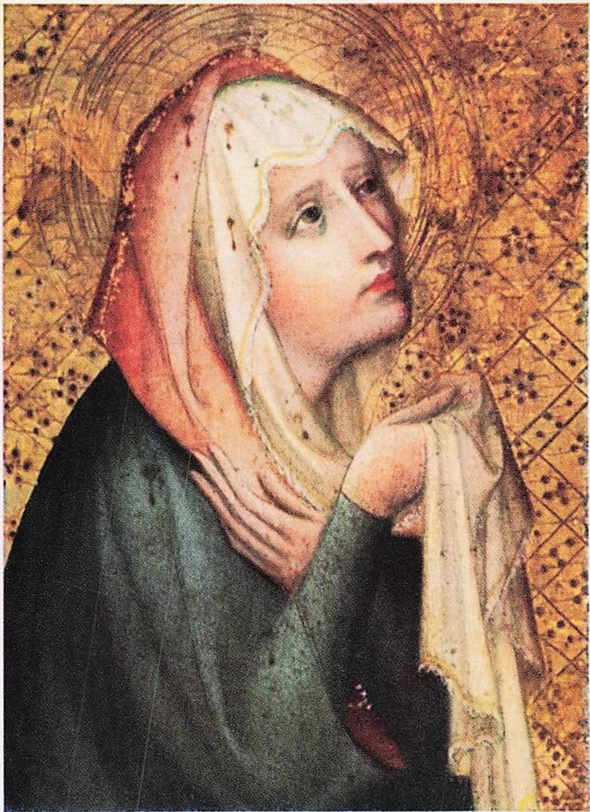
Pähl, um 1500